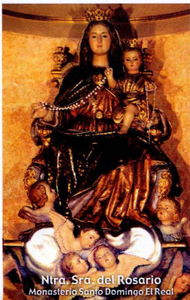
Ntra. Sra. del Rosario Monasterio Santo Domingo El Real