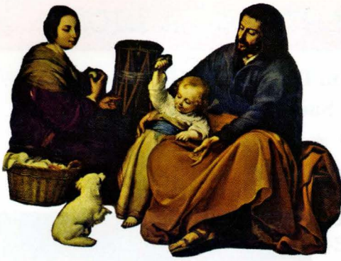
Jesús, José y María, nuestro modelo.

La verdadera vida familiar cristiana lo mismo que la vida cristiana se funda en la abnegación, en el amor que da la vida. Vida de Nazaret, vivida en la oscuridad de la fe pero llena de amor. La Sagrada Familia es nuestro modelo.